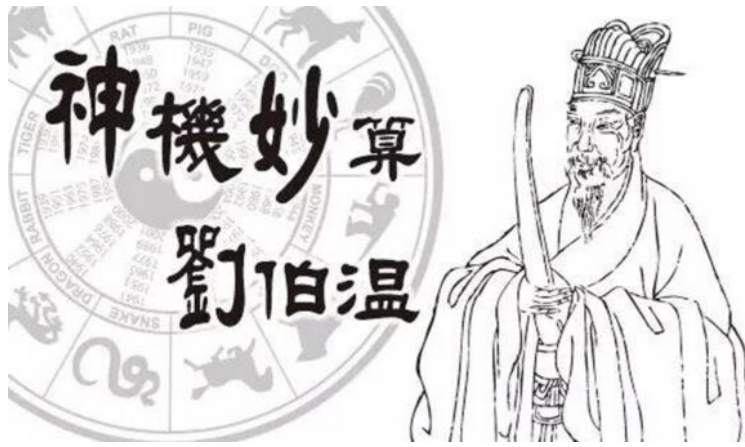
刘伯温碑记。（网络制图）