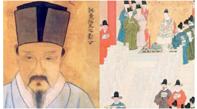
刘伯温是明朝开国宰相，也是一位得道高人，他为后世留下了许多预言。