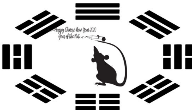
2020年适逢庚子年，“庚”是金，“子”是鼠，2020是金鼠年。

解：这场劫难来势凶猛，“作恶之人”恐怕连后悔的机会都没有，就被淘汰了。而“行善之人”目睹这一切，当有人给你传《九评》，讲真相，而有人盲从中共，拒绝真相，不愿脱离中共不抹去身上的兽印，因而成为中共的陪葬真是“不上算”。